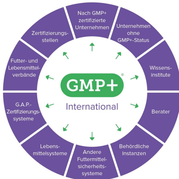
[Abbildung: Stakeholder in der GMP+ Community ]